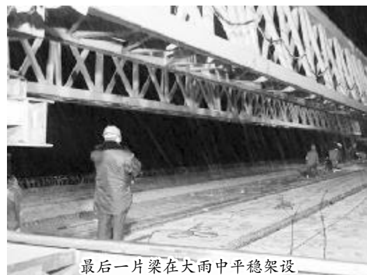
最后一块梁在大雨中平稳架设

江口铁路跨线桥上跨京九铁路段位于5#墩和6#墩之间,采用14片50m预应力混凝土T梁,与京九铁路呈42度角相交,并同时上跨G323国道。因受春运影响,江口铁路跨线桥实施的Ⅱ级线路封锁施工分两个阶段进行,第一阶段在春运前完成左幅7片T梁的架设任务,第二阶段计划春运后完成剩余工程。此次施工封锁计划时间为1月15日至1月22日,共计6个封锁点,每个封锁点时间为115分钟,主要施工内容是架桥机过孔和7片50米T梁架设。