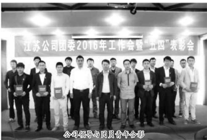
公司领导与团员青年合影

2015年团委工作情况并安排部署了2016年工作重点；各团支部汇报了各自特色和亮点工作；表彰了2015年度公司先进集体和个人。