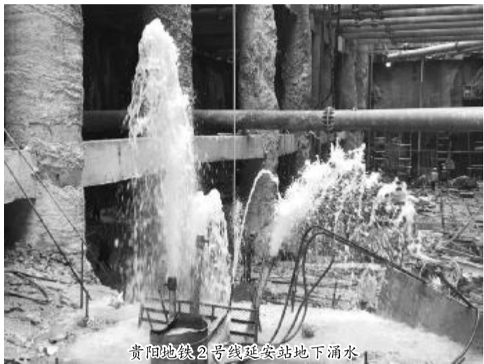
贵阳地铁2号线延安站地下涌水

本报讯 “我们成功了！”近日，贵阳地铁2号线延安路站工地一片沸腾，南昌公司贵阳地铁项目部员工在欢呼成功阻击各路专家称为“中国地铁第一涌水”。 在离原地面17米深的延安站明挖基础上，大小涌水点已不再冒水，尤其是两口直径达半米多的地下喷泉偃旗息鼓了，像一个泄了气的皮球，再也折腾不起来，留下两泓平镜似的死水口。这场历经143天的“地下迷宫之