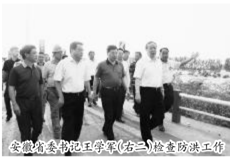
安徽省委书记王学军(右二)检查防汛工作

6月30日以来，合肥地区发生了连续的强降雨，安徽公司迅速在各个项目部组织了防汛抢险队。7月5日21时许，长临河镇境内南淝河姚埠圩段发生部分坍塌。阚宏明和