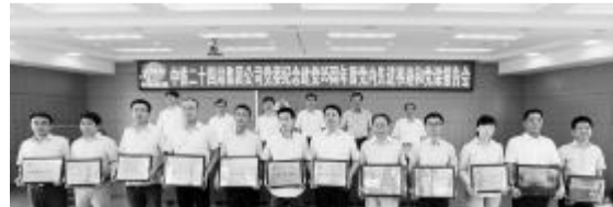
集团公司基层党组织和“打造战斗堡垒、争当建设先锋”示范点代表上台领奖

集团公司领导班子成员，集团公司机关全体党员和入党积极分子、上海地区各子(分)公司党政主管和党委工作部负责同志、集团公司党委“两学一做”学习教育督导组及受表彰的先进集体和优秀个人代表等140余人在主会场参加。所属各单位领导班子成员、各子(分)公司机关和各区域指挥部、直管项目(指挥部)全体党员和入党积极分子在分会场参加。(党委组织部 党委宣传部)