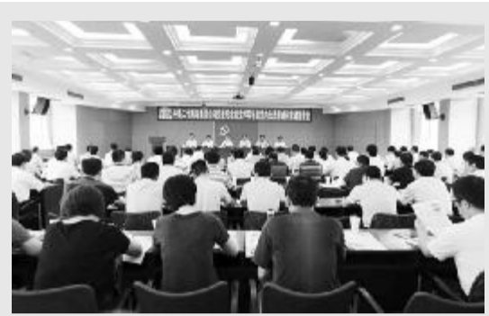
集团公司党委纪念建党95周年暨党内先进事迹和党课报告会会场

中共中铁二十四局集团有限公司委员会主办 2016年7月22日 星期五 第13期 (总第251期)