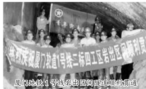
厦门地铁 1 号线岩出区间暗挖隧道顺利贯通

本报讯 由福建公司承建的厦门地铁 1 号线二标四区岩出区间暗挖隧道于 9 月 14 日 11 时顺利贯通,取得关键工期节点的胜利。