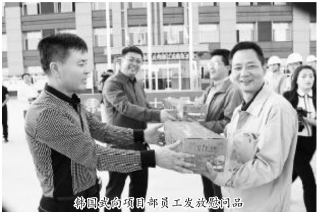
韩国武向项目部员工发放慰问品

本报讯 9月12日下午，通辽至新民北客专三标项目部开展中秋慰问活动。羊、月饼等慰问品，到集团公司