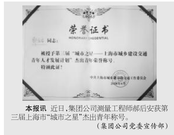
本报讯 近日,集团公司测量工程师郝后安获第三届上海市“城市之星”杰出青年称号。 (集团公司党委宣传部)

中共中铁二十四局集团有限公司委员会主办 2016年9月19日 星期一 第17期 (总第255期)