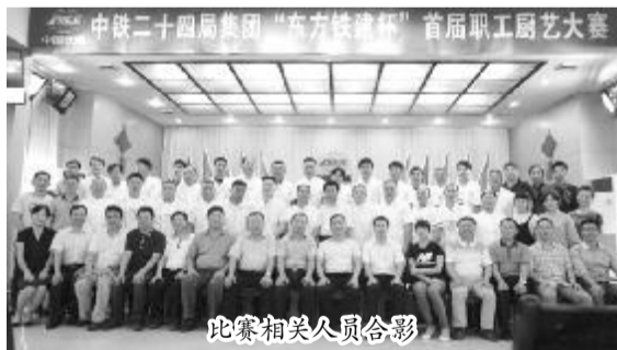
比赛相关人员合影

本报讯 9月10日至11日,集团公司成功举办“东方铁建杯”首届职工厨艺大赛,并授予获得前三名个人选手集团公司“技术能手”称号。