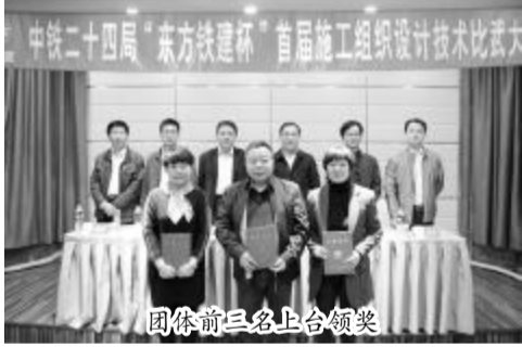
团体前三名上台领奖