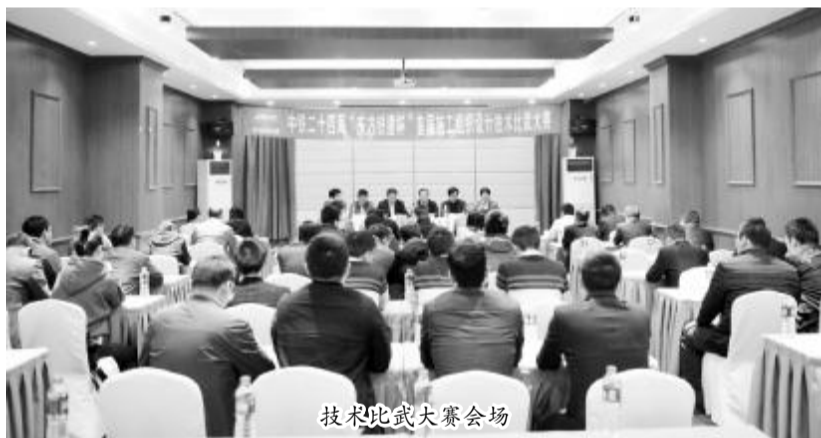
技术比武大赛会场