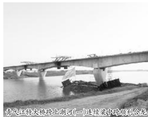
青弋江特大桥跨上潮河(一)连续梁中跨顺利合龙

该连续梁跨越上潮河有3个水中墩,基坑深达10米,皖赣铁路I标二分部因地制宜,采用长18米的拉森钢板桩围堰,攻克了深基坑施工难题。今年安徽汛情严重,河水上涨剧烈,上潮河水位标高达8.6米。项目部创新立异地在水中墩和邻跨梁上搭设贝雷梁临时便桥,打开了汛期连续梁中跨施工材料运输和混凝土浇筑的通道,采取天泵与地泵配合施工,克服了水中大跨度混凝土浇筑的难题。(浙江公司 赵伟 孙璞玉)