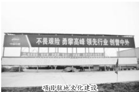
项目驻地文化建设

本报讯 11月14日至16日,集团公司“东方铁建杯”首届施工组织设计技术比武大赛在上海公司京沪铁路无锡北至无锡段改造工程项目部成功举办。经各单位认真选拔推荐,共30位选手参加此次比武。