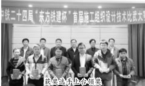
获奖选手上台领奖