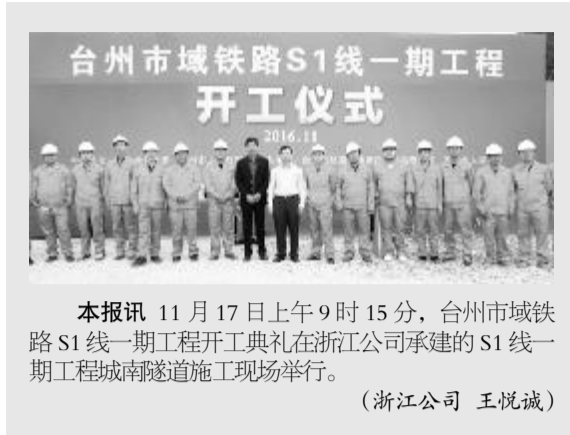
台州市域铁路S1线一期工程开工仪式 2016.11 本报讯 11月17日上午9时15分,台州市域铁路S1线一期工程开工典礼在浙江公司承建的S1线一期工程城南隧道施工现场举行。 (浙江公司 王悦诚)

中共中铁二十四局集团有限公司委员会主办 2016年11月17日 星期四 第22期 (总第260期)