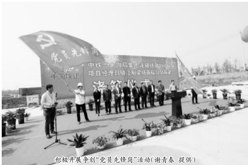
积极开展争创“党员先锋岗”活动