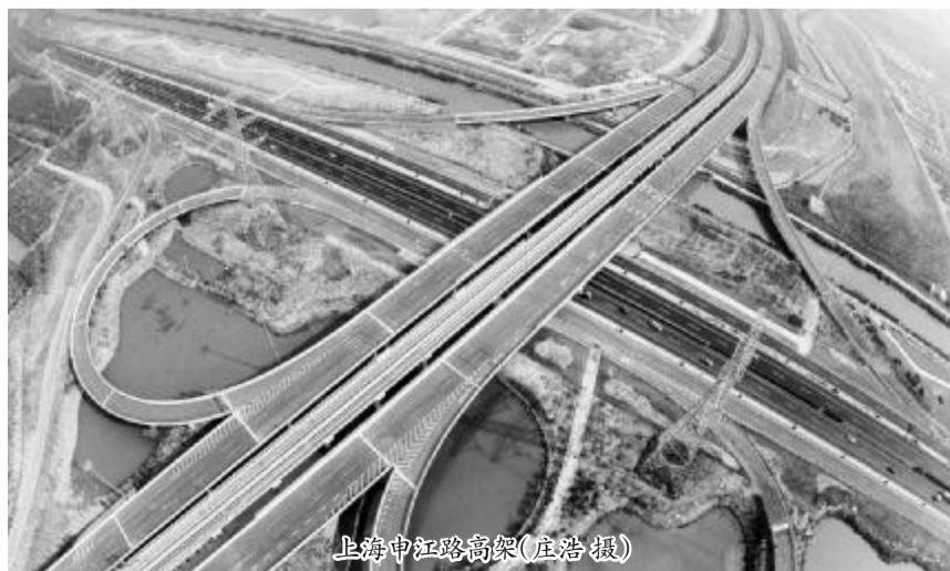
上海中江路高架

他们制订了《落实“两个责任”实施意见》及 1+7 配套办法,推出了所属单位党委、纪委组织责任清单和落实“两个责