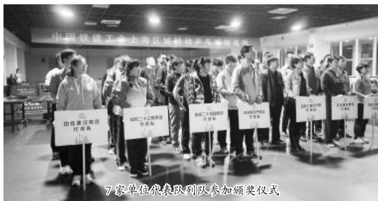
7家单位代表队列队参加颁奖仪式

本报讯 11月19日上午,中国铁建工会上海区域联动乒乓球精英赛落下帷幕。来自中国铁建所属在沪单位的中铁十五局集团二公司、中铁二十三局集团上海轨道交通公司、中铁二十四局集团上海公司、中铁建设集团华东公司、中铁地产集团华东公