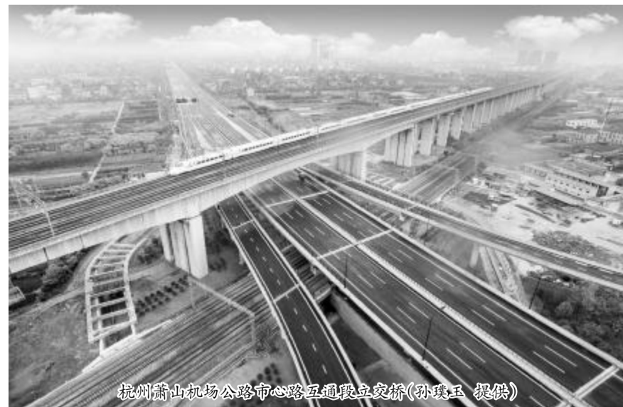
杭州萧山机场公路市中心路互通立交