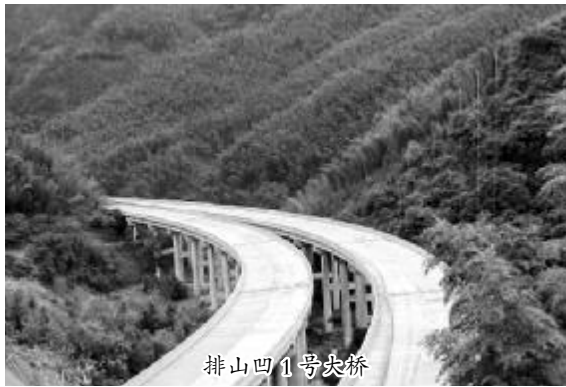
排山凹 1 号尖桥

本报讯 11 月 27 日,随着大叶岭大桥左线第七跨最后一块预制 T 梁的吊装就位,广西资兴高速公路第七标段一工区已全部完成计划内的 708 片 T 梁的预制和架设,领跑全线,为项目部早日实现竣工交验目标奠定了坚实的基础。