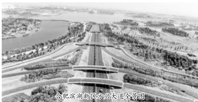
合肥滨湖新区方兴大道全景图

本报讯 刚刚从中国建筑业协会获悉,由安徽公司承建的合肥滨湖新区方兴大道(包河大道-福建路)工程捧得