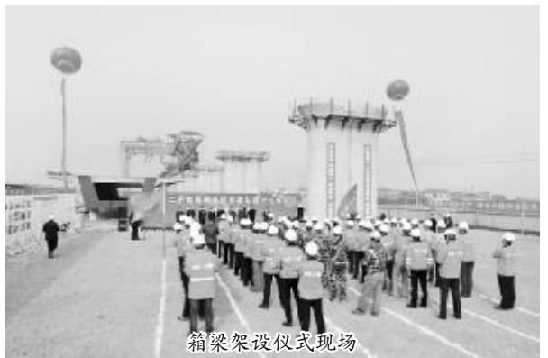
箱梁架设仪式现场