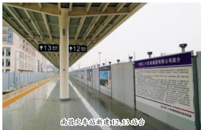
南昌火车站新建 12、13 站台

南昌火车站是京九铁路唯一的省会城市车站,从那里鱼贯而出、鱼贯而入的一列列火车,汇入到全国的铁路交通网。对南昌火车站进行全面改造,就像做心脏手术,稍有不慎,就可能发生影响行车安全的严重事故。南昌公司及其项目部把安全作为施工的头等大事,夯实安全风险,找准把住风险源,将安全措施落实到风险点上,确保了行车安全、施工安全和人身安全,并且比计划工