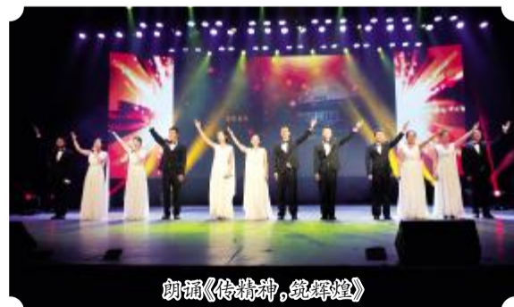
朗诵《奉献精神,筑辉煌》