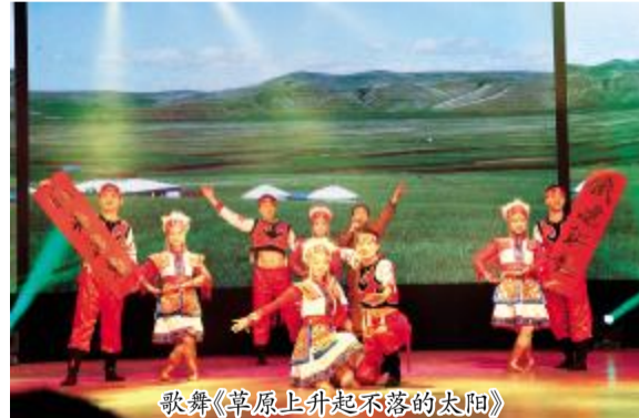
歌舞《草原上起不落的太阳》