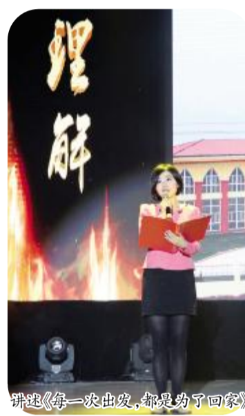
讲述《每一次出发,都是为了回家》