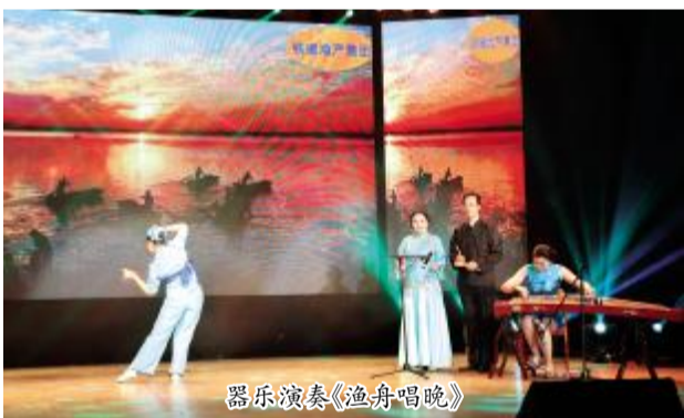
器乐演奏《渔舟唱晚》