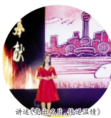
讲述《亮出名片,传递温情》