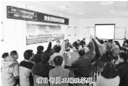
项目部员工踊跃答题

本报讯 春节的气息还未散去,元宵佳节已悄悄来临,为了使节日期间仍然坚守岗位不能与家人团聚的一线员工度过一个平安祥和的元宵佳节,设备安装公司商合杭架梁分部举办“节后复工”安全知识竞赛。局指安全总监、安质部部长观看了竞赛活动。