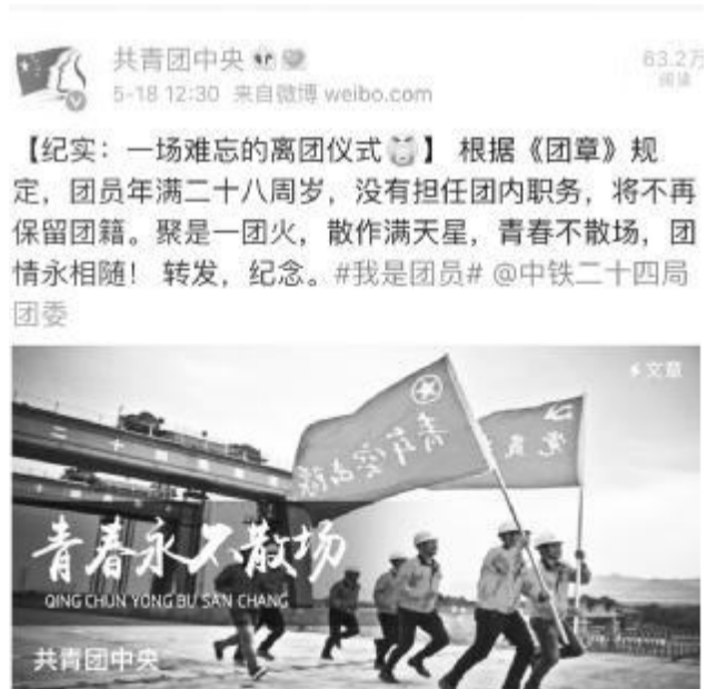
离团不离心,永远跟党走!一场难忘的离团仪式