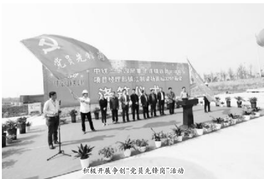
积极开展争创“党员先锋岗”活动

在中华民族伟大复兴之路上,始终有一座城市攻坚克难、砥砺奋进,那就是中国共产党的诞生地、矗立在东方的上海;