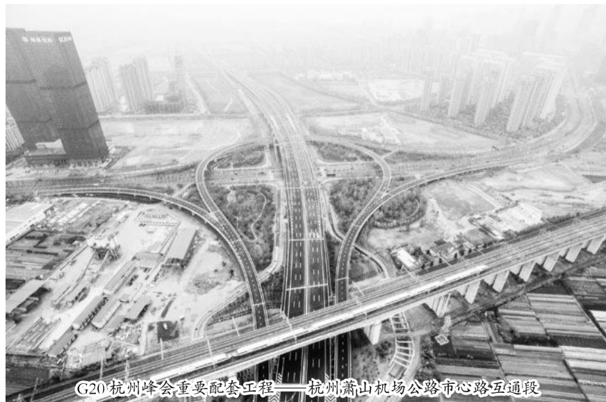
G20杭州峰会重要配套工程——杭州萧山机场公路市心路互通段

强化党建量化考核。严格落实党建责任制,集团公司分别与工程公司党委、项目(指挥)部党工委签订党建工作责任书,全面开展党组织书记抓党建述职评议工作,对党建工作进行量化考核,并将考核结果与年度绩效、评优评先、职务任免、“四好”班子评比紧密挂钩,把“软指标”变成“硬任务”,发挥考核“指挥棒”作用。