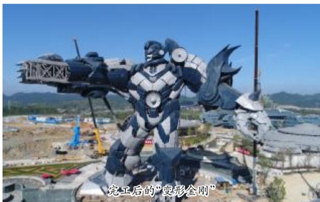
完工后的“变形金刚”

“变形金刚”钢结构制安工程钢构件种类及数量多,场地局限,工期异常紧张,技术难度大,质量精度要求高,造型组装复杂。项目部在安装过程各阶段对结构的内力、稳定性做了位移