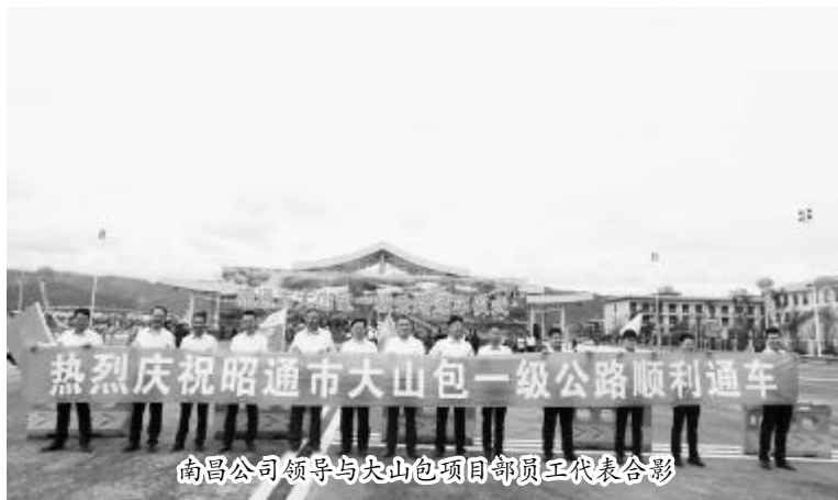
南昌公司领导与大山包项目部员工代表合影

南昌公司承建的二标段位于昭通市昭阳区永丰镇和苏家院镇境内，长14.81公里，于2016年3月正式开工建设。项目部在集团公司的正确领